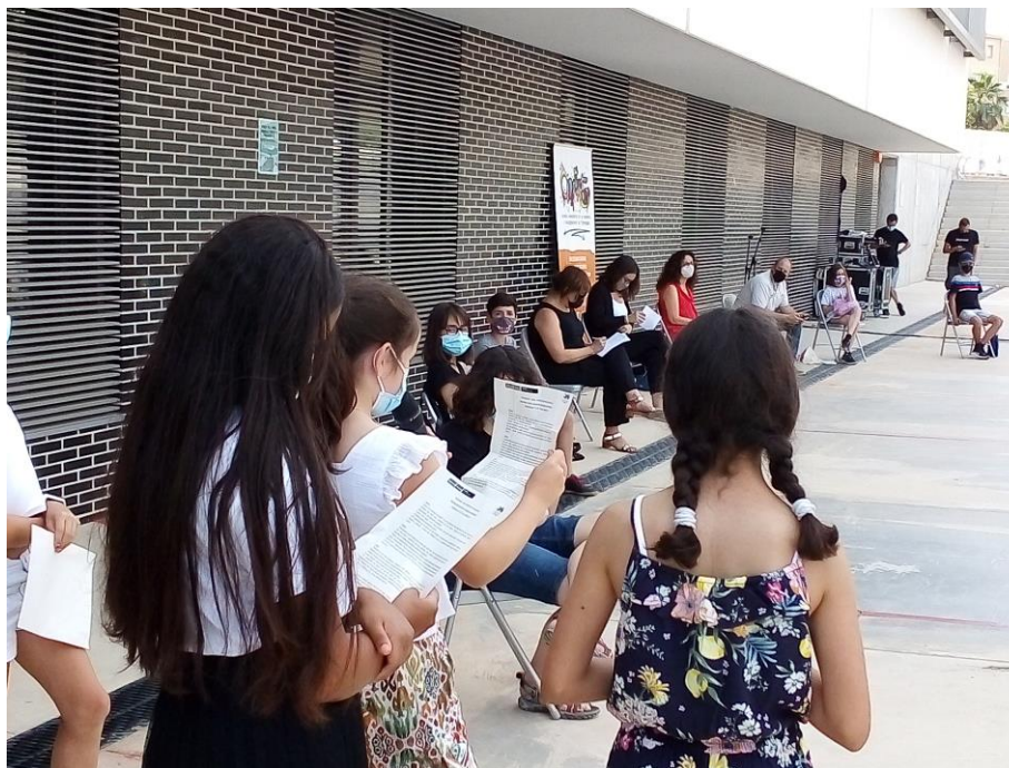
foto del plenari de cloenda del CMIAT curs 2020-21

Cada Eix del PLIA s'ha relacionat amb 4 drets que són els que s'ha demanat les propostes. Els drets són: Dret a participar i a estar informats i informades, Dret a la protecció, al benestar i a la salut, Dret a l'educació dins i a fora de l'escola, Dret a gaudir de l'espai públic i un entorn segur.